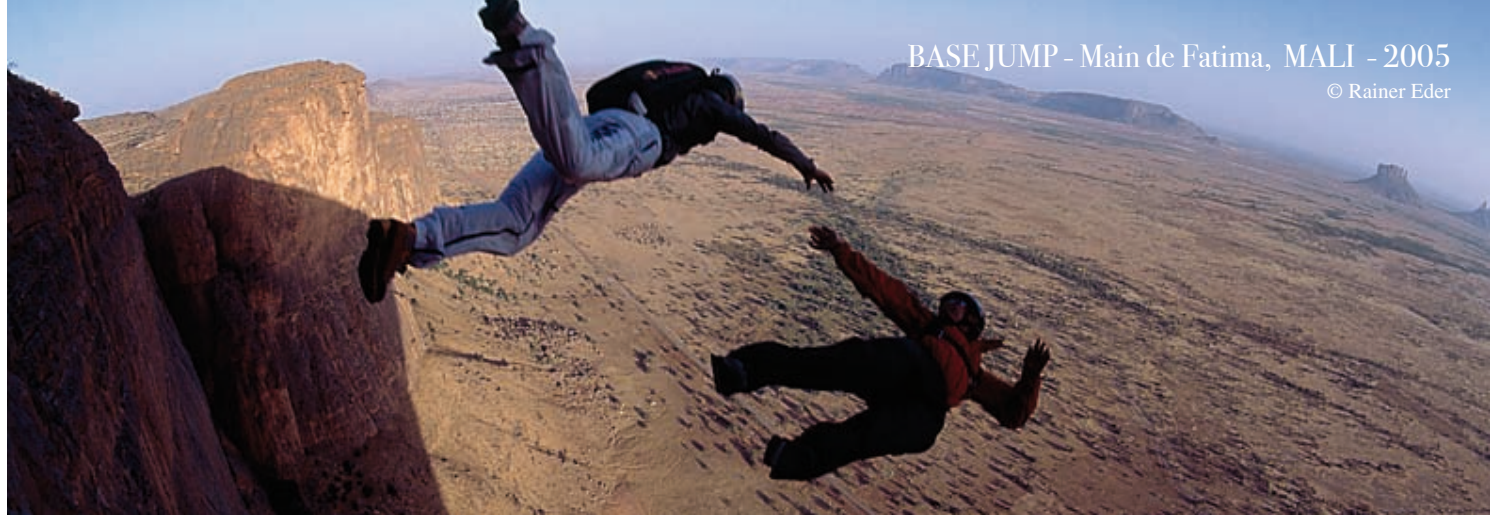
BASE JUMP - Main de Fatima, MALI - 2005

LE BASEJUMP ou encore Paralpinisme est la discipline engagée du parachutisme qui se pratique en montagne depuis le haut de falaises verticales. Cela consiste à sauter puis voler en chute libre quelques secondes et ouvrir son parachute pour se poser en douceur. Les vitesses verticales peuvent atteindre 200 km/h.