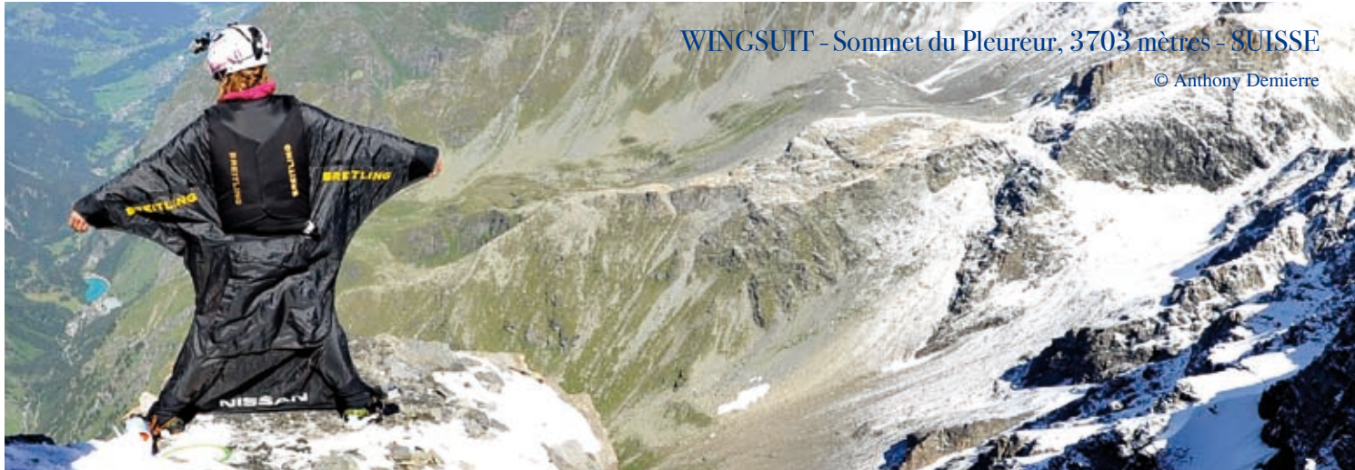
WINGSUIT - Sommet du Pleureur, 3703 mètres - SUISSE

LA WINGSUIT est une combinaison en forme d'aile qui augmente la portance et permet de voler. En base jump, cette technique permet d'allonger le temps de vol et de jouer avec le relief du rocher à la manière des oiseaux. Une falaise de 1000 mètres de haut peut permettre un vol de 3000 mètres.