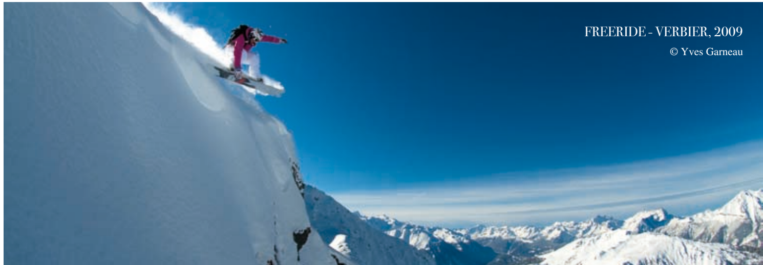
FREERIDE - VERBIER, 2009

LE FREERIDE c'est rider dans une nature vierge sur tous les terrains qu'offre la montagne. Le plaisir est de jouer dans les pentes entre les glaciers, les couloirs et les barres rocheuses pour glisser et sauter à la recherche des plus belles lignes.